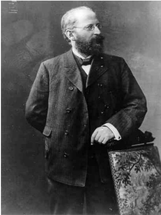
Eduard Bernstein (1850–1932)

Działalność partii socjaldemokratycznych w okresie międzywojennym swe ideologiczne oparcie znajdowała w myśli politycznej Eduarda Bernsteina. Ten wybitny działacz socjalistyczny odrzucił marksistowski dogmat o rewolucji proletariackiej jako jedynej drodze wyzwolenia klasy robotniczej. W zamian proponował podjęcie walki przez partie socjalistyczne na gruncie procedur demokratycznych.