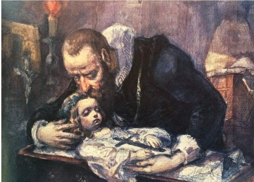
Jan Matejko, Jan Kochanowski nad zwłokami Urszulki , 1862 (szkic do obrazu)

Na obrazie Jana Matejki Jan Kochanowski pochyla się nad trumną zmarłej córeczki. Wybierz jeden z trenów Kochanowskiego (V, VII lub VIII), który najlepiej odpowiada treści obrazu. Uzasadnij swoją odpowiedź.