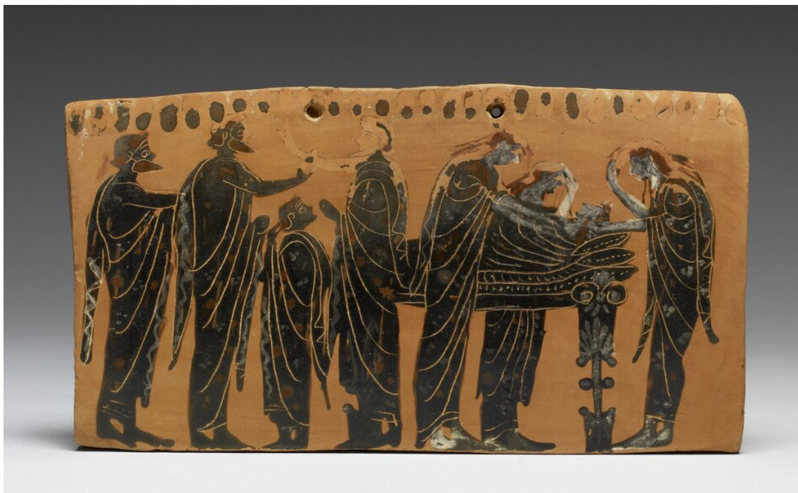
Obrzędy pogrzebowe w starożytnej Grecji, plakietka nagrobna