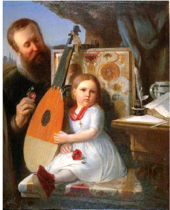
Władysław Łuszczkiewicz, Jan Kochanowski z Urszulką , przed 1900

Choć jej istnienie nie zostało potwierdzone przez inne niż Treny świadectwa, jest najśłynniejszym dzieckiem renesansu. Niektórzy badacze literatury twierdzą, że Urszulki Kochanowskiej w ogóle nie było, nie znamy bowiem miejsca jej pochówku, a daty urodzin i śmierci zostały ustalone wyłącznie na podstawie roku wydania Trenów . Czyżby poeta wymyślił postać małej córeczki jako swego rodzaju pretekst do napisania cyklu żałobnych utworów? Ta kontrowersyjna teza ma swoich zwolenników. Bez względu na to, jak było naprawdę, jedno jest pewne: Jan z Czarnolasu stworzył niezwykle poemat, którego bohaterką jest mała Urszulka, ukochana, przedwcześnie zmarła córka poety.