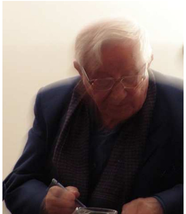
Tadeusz Różewicz w Pradze, 15.10.2007