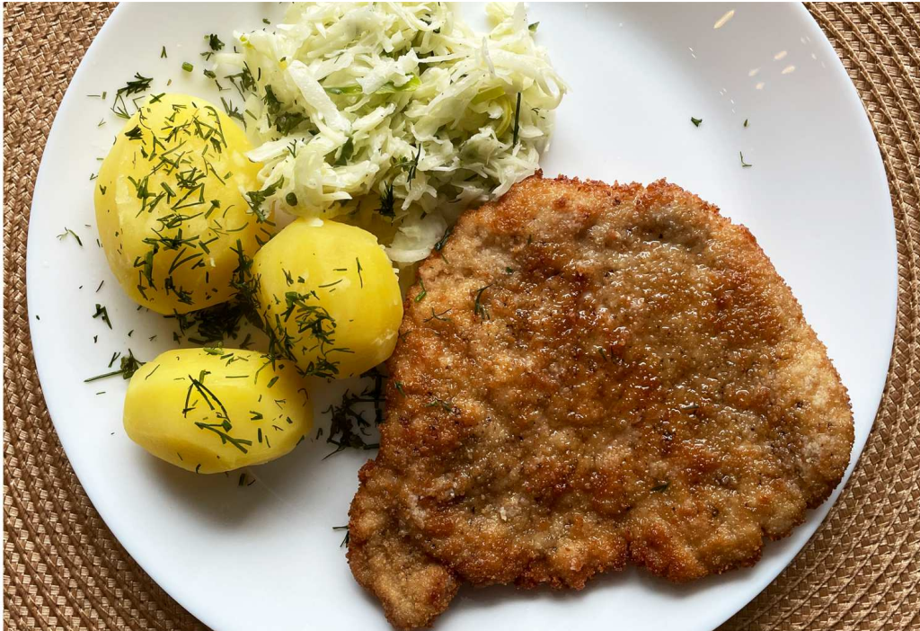
La cotoletta schabowy

Leggi il testo sulla cucina polacca e rispondi alle domande.