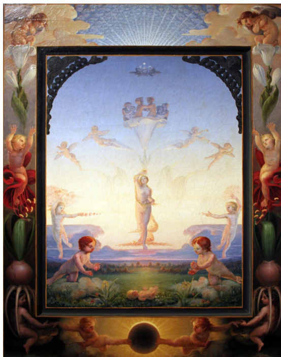
Philipp Otto Runge, Poranek. Alegoria (studium do obrazu), 1808