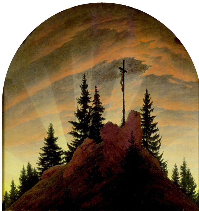
Caspar David Friedrich, Krzyż w górach , 1807–1808

Na obrazach innego niemieckiego romantyka, Caspara Davida Friedricha (1774–1840), natura staje się przejściem ku Bogu, bramą do innego świata. Drezdeński malarz widział w naturze granicę między światem doczesnym a transcendentnym, subtelnie zarysowaną grą światła i barw. Natura stawała się dla niego swoistym medium między człowiekiem a Tajemnicą Nieskończoności. To emocjonalne i uczuciowe stapianie się z przyrodą wiązało się dla romantyków z umiejętnością dostrzegania wysyłanych przez nią znaków, poddawaniem się niekiedy jej potędze, ale też próbą przeciwstawiania się żywiołom.