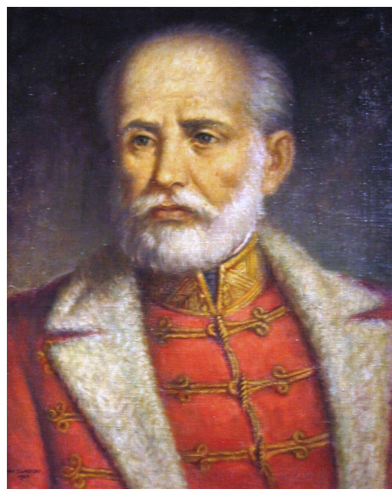
Portret Józefa Bema, autor nieznany