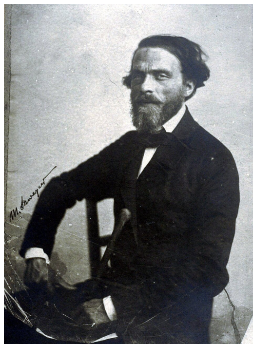
Cyprian Kamil Norwid, 1871

Jednym z ciekawych i bardzo swoistych poetów romantycznych jest Cyprian Kamil Norwid, czasem nazywany „czwartym wieszczem”. Norwid był w pewnym sensie epigonem romantyzmu, jego debiut miał bowiem miejsce w 1840 roku, kiedy w Europie tendencje romantyczne były już u schyłku, a w polskich realiach od dekady kultura podzieliła się na romantyzm krajowy oraz emigracyjny. Najważniejsze utwory Norwida powstały po śmierci Mickiewicza i na przełomie lat 50. oraz 60., gdy społeczeństwo zaczynało otwierać się na nowe wpływy i wartości.