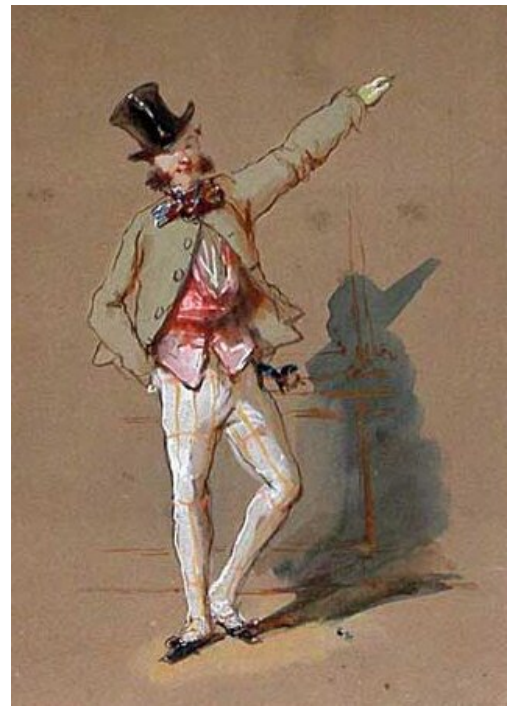
Paula Gavarni, Dandys w Paryżu

poświęcił przede wszystkim bogatej korespondencji (w której uwiecznił m.in. swą wielką idealną miłość do Delfiny Potockiej); wydał jeszcze tylko trzy poematy: Trzy myśli pozostałe po śp. Henryku Ligenzie , Przedświt , Resurrecturis oraz Psalmy przyszłości . Głosił w nich idee konserwatywne i mesjanistyczne , ujawniał zaszczepioną przez ojca gwałtowną niechęć do rewolucji (za którą uważał także powstanie). Wierzył natomiast w odzyskanie niepodległości Polski na drodze pokojowej ewolucji oraz dzięki Boskiej Opatrzności.