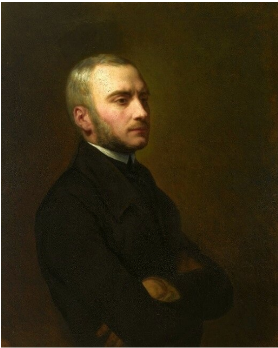
Ara Scheffer, Portret Zygmunta Krasińskiego , 1850