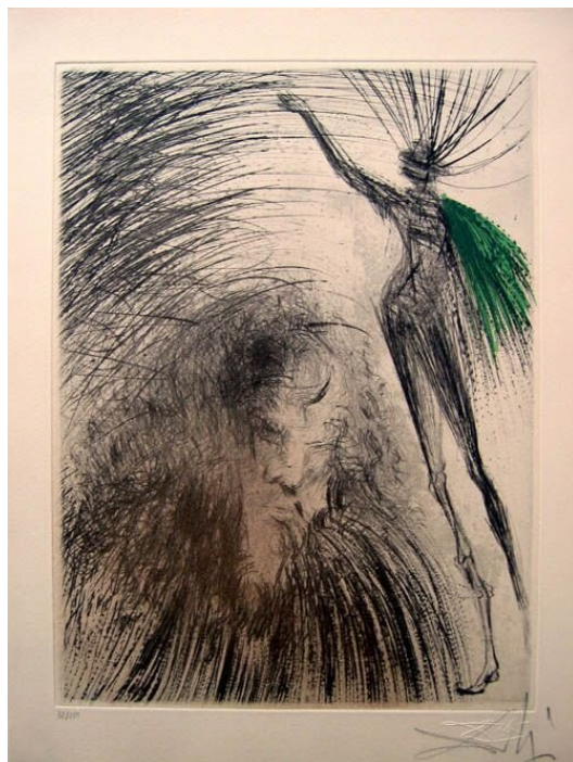
Salvador Dalí poświęcił postaci Fausta cały cykl. Tutaj obraz z 1968 roku.

Inną odsłoną nawiązania do mitu faustowskiego jest dramat Paula Valéry'ego Mój Faust (1941), w którym francuski pisarz stawia tezę o nieżyteczności pomocy Mefistofelesa w życiu współczesnego człowieka: