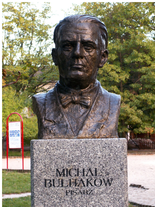
Popiersie Michaiła Bułhakowa

eksperymentem społecznym. Tragiczne losy rosyjskiej inteligencji w czasie rewolucji zawarł w powieści Biała gwardia . Miał jednak poważne problemy z cenzurą , przez co część jego utworów nie mogła znaleźć wydawcy za jego życia (w 1929 r. zostaje wydany zakaz publikowania i wystawiania na scenie jego tekstów). Największe dzieło Bułhakowa, które zapewniło mu międzynarodową sławę, to powieść Mistrz i Małgorzata , która ukazała się drukiem dopiero pod koniec lat 60.