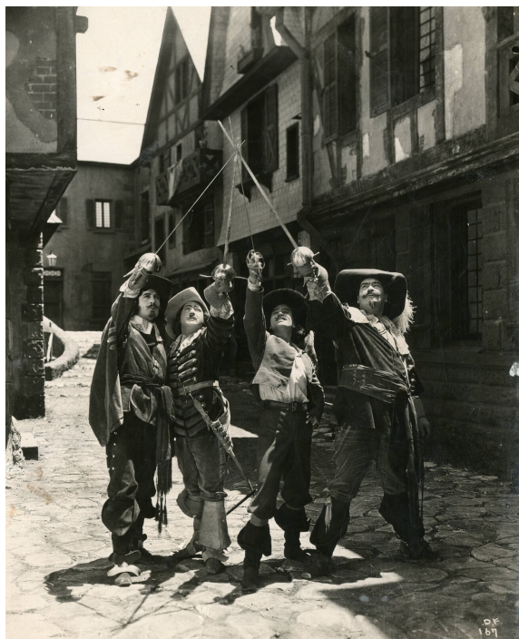
Kadr z filmu „Trzej muszkietierowie” z 1921 roku