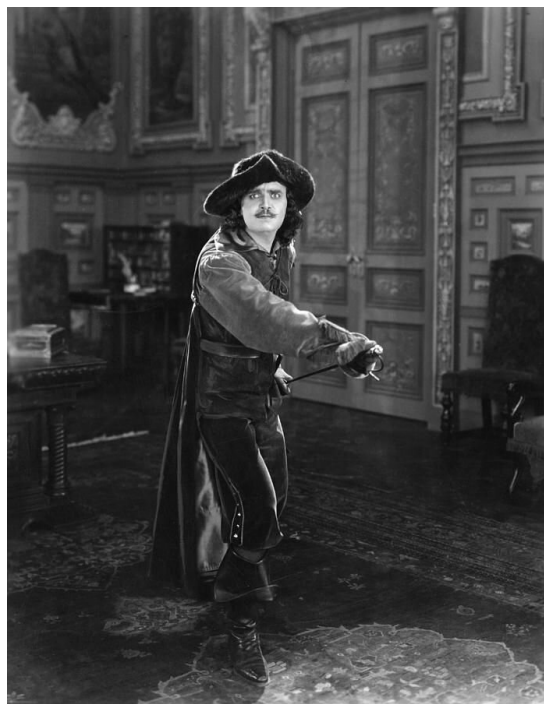
Douglas Fairbanks w roli d'Artagnana