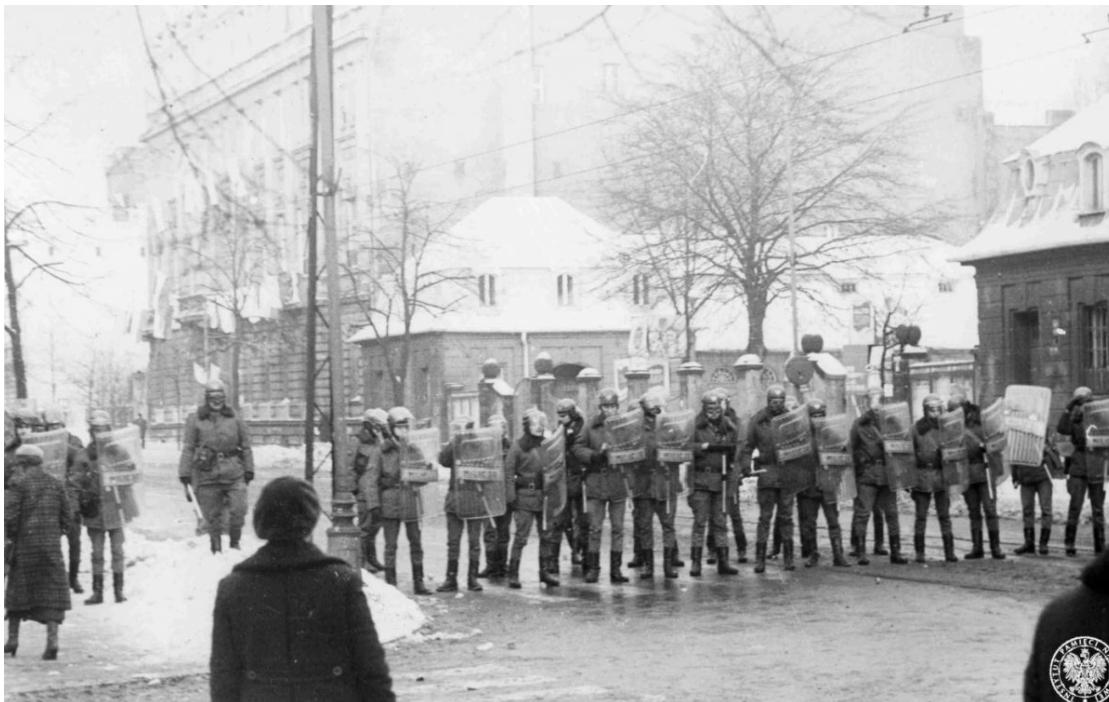
Funkcjonariusze ZOMO w bojowym rynsztunku, Łódź, grudzień 1981 roku.

Źródło: IPN, dostępny w internecie: ipn.gov.pl [dostęp 16.02.2022 r.], tylko do użytku edukacyjnego.