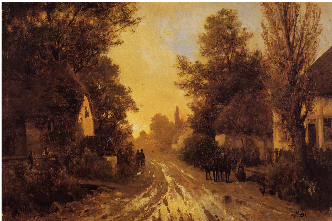
Wiejska droga jesienią

Źródło: Zygmunt Sidorowicz, 1878, Muzeum Narodowe we Lwowie, domena publiczna.