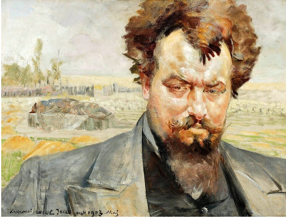
Jacek Malczewski, Portret Jana Kasprowicza (1903)