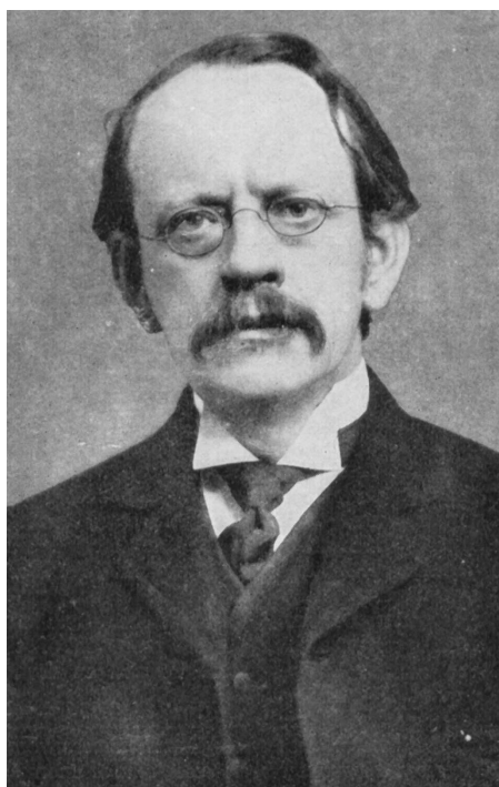
Rys. 1. Joseph John Thomson

Pogląd o niepodzielności atomu utrzymywał się przez ponad 2500 lat (!), aż do roku 1897, kiedy to brytyjski fizyk Joseph John Thomson przeprowadził eksperyment udowadniający, że atom nie jest najmniejszą cząstką, a w jego wnętrzu „coś” się znajduje. Tym „czymś” były elektrony i dodatnio naładowana materia. Thomson zaproponował pierwszy (niepoprawny) model atomu, który następnie był udoskonalany dzięki wynikom eksperymentów (m.in. Ernesta Rutherforda, również brytyjskiego fizyka) oraz rozważaniom teoretycznym (m.in. Nielsa Bohra, Louisa de Broglie oraz Erwina Schrödingera).