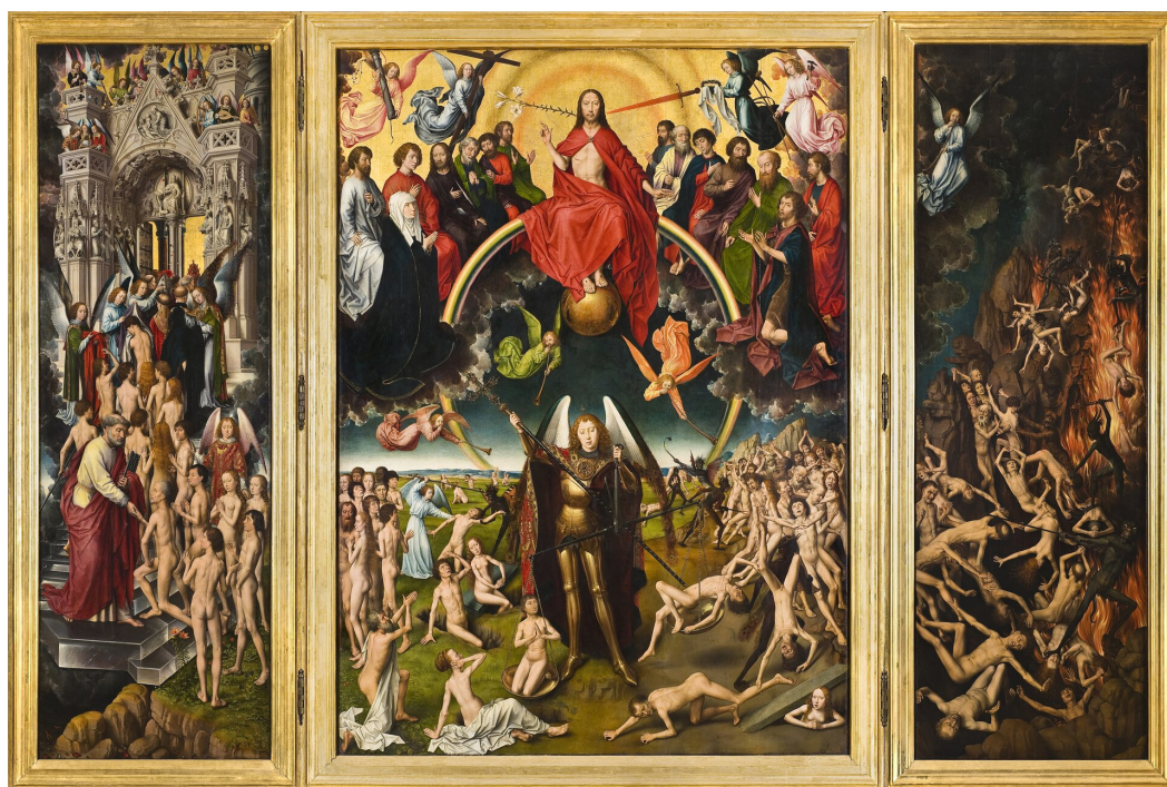
Hans Memling, Sąd Ostateczny , 1466–1473

symboliką jest metaforycznym ujęciem dziejów Kościoła, ale przede wszystkim wizją walki dobra ze złem. Niezwykle sugestywne opisy klęsk spadających na ziemię, upadku Nowego Babilonu i przebiegu Sądu Ostatecznego powodują, że Apokalipsa, w powszechnym rozumieniu, jest symbolem zagłady, wielkich zniszczeń, ostatecznej klęski ludzkości. Święty Jan opisuje wydarzenia, które następują po otwarciu przez Baranka siedmiu pieczęci „księgi zapisanej wewnątrz i na odwrocie”. Dźwięki siedmiu archanielskich trąb zapowiadają przybycie Czterech Jeźdźców Apokalipsy i kolejne zdarzenia, trzęsienie ziemi, ciemności, zapadnięcie gór. Księżyc przybiera krwistą barwę, słońce staje się czarne, spadają gwiazdy i grad ognisty, wybuchają pożary i wulkany, wszelkie wody ulegają zatruciu. Pojawiają się Jeźdźcy Apokalipsy symbolizujący zarazę, wojnę, głód i śmierć. Warto jednak zwrócić uwagę, że św. Jan wieszczy zagładę wrogim narodom, nie wszystkim ludziom. Dla prześladowanych chrześcijan końca I stulecia była to wizja ocalenia Kościoła i powstania Miasta Bożego. Apokalipsa, mimo swej katastroficznej otoczki, ma przesłanie optymistyczne, objawia przyszłość, w której dobro zwycięża zło. Triumfują sprawiedliwi, czyli ci, którzy wytrwali przy Bogu, On przygotował Nowe Jeruzalem, a tam: „śmierci już nie będzie Ani żałoby, ni krzyku, ni trudu już nie będzie (Ap 21, 4)”.