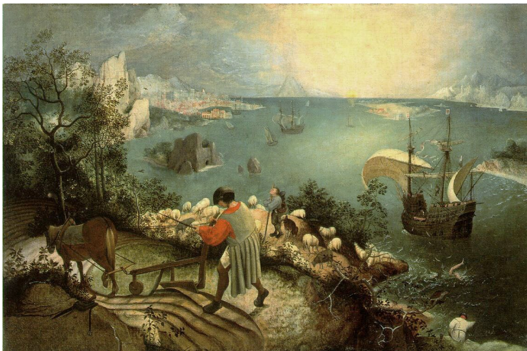
Pieter Bruegel Starszy, Pejzaż z upadkiem Ikara , ok. 1555–1558