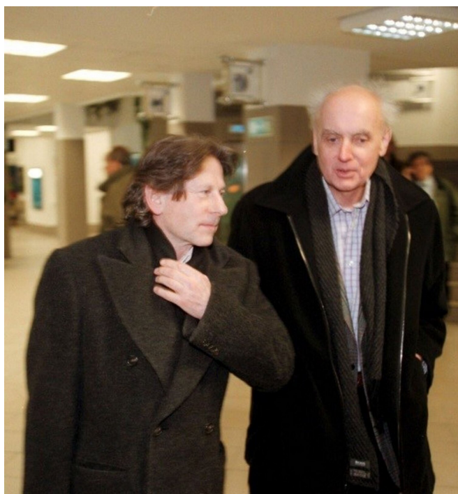
Wojciech Kilar z Romanem Polańskim

Na początku lat pięćdziesiątych Francis Ford Coppola powierzył mu napisanie muzyki do swojego remake'u – klasycznego filmu grozy Dracula . Kompozycja ta szerokim echem odbiła się po całym świecie, przynosząc Kilarowi liczne słowa uznania i nominację do nagrody Saturn . Światową renomę przyniosła mu również współpraca z Romanem Polańskim zapoczątkowana filmem Śmierć i dziewczyna w 1995 r. Ich kolejne wspólne filmy to: Dziewiąte wrota i Pianista .