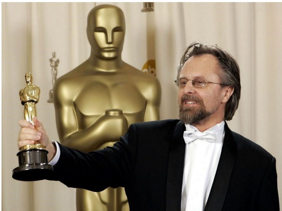
Jan A. P. Kaczmarek z Nagrodą Akademii Filmowej

Kaczmarek zdobył także jedną z najważniejszych nagród w branży filmowej – w 2005 r. otrzymał Nagrodę Akademii Filmowej Oskar za muzykę do filmu Marzyciel wyreżyserowanego przez Marca Forstera. Za muzykę do tego filmu dostał też nagrodę National Board of Review dla najlepszego kompozytora oraz nominacje do Złotego Globu i nagrody Brytyjskiej Akademii Filmowej (BAFTA).