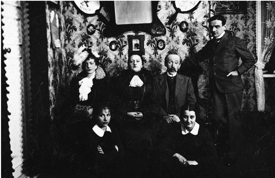
Przedstawienie Moralność pani Dulskiej Gabrieli Zapolskiej w Teatrze Miejskim w Wilnie, scena zbiorowa (1935)