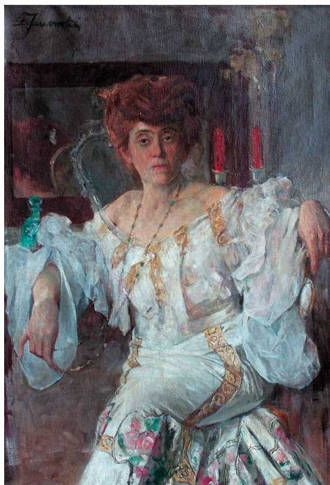
Stanisław Janowski, Portret Gabrieli Zapolskiej , ok. 1921