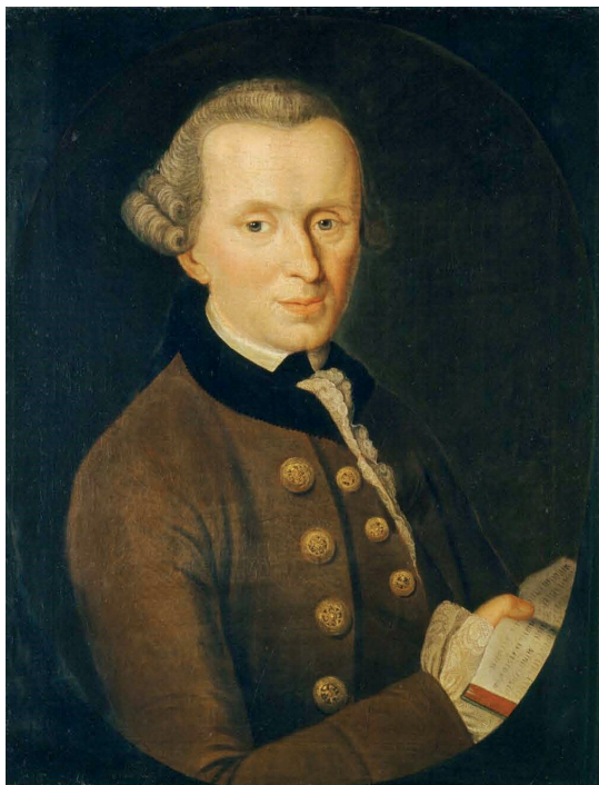
Immanuel Kant (1724–1804).

Koncepcja etyczna, stworzona przez Immanuela Kanta, jest etyką skrajnie racjonalistyczną, którą on sam nazywał metafizyką moralności. Dlatego najpierw należy poprawnie zrozumieć jego interpretację terminu „metafizyka”.