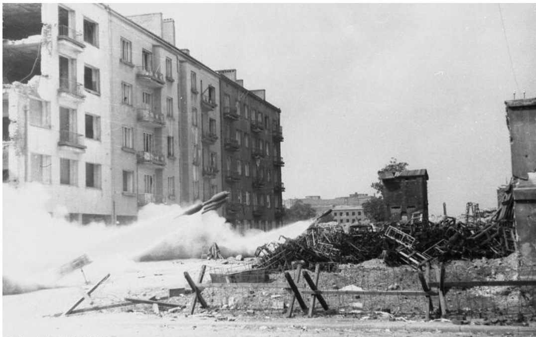
August 1944