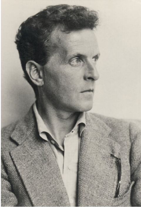
Ludwig Wittgenstein (1889–1951)