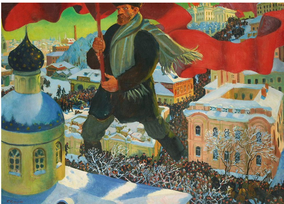
Boris Kustodijew, Bolszewik (1920).