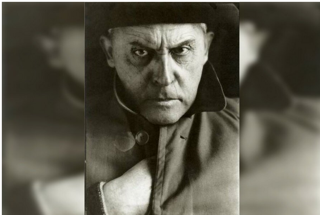
Stanisław Ignacy Witkiewicz