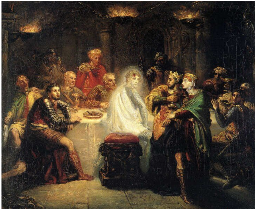
Théodore Chassériau, Duch Banqua , pomiędzy 1854 a 1855