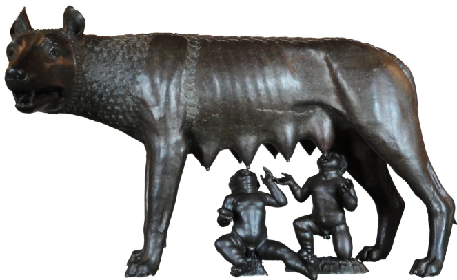
Wilczyca kapitolńska karmiąca Romulusa i Remusa