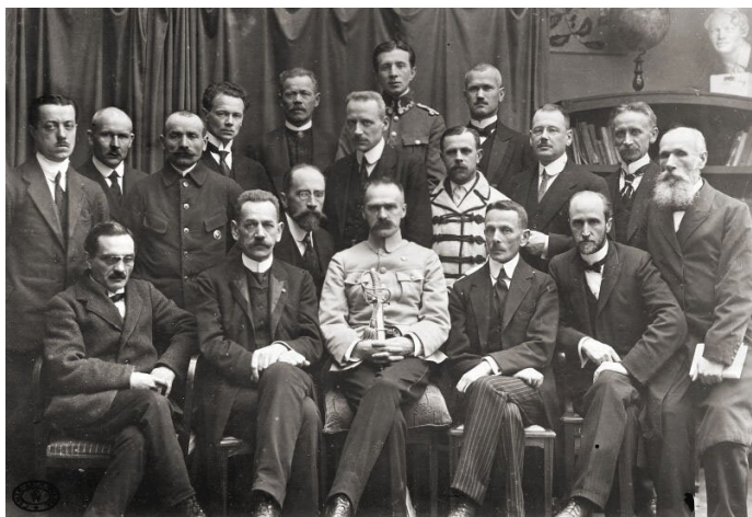
Rząd Jędrzeja Moraczewskiego.