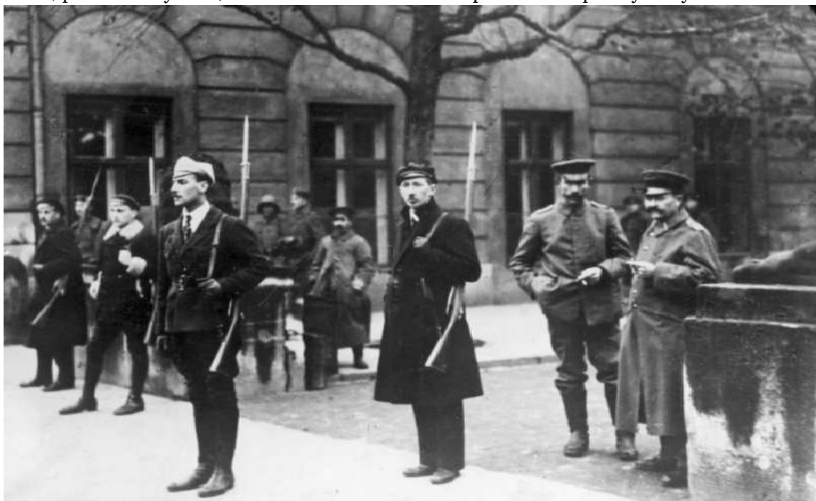
Rozbrajanie Niemców w Warszawie, 11 listopada 1918 r.