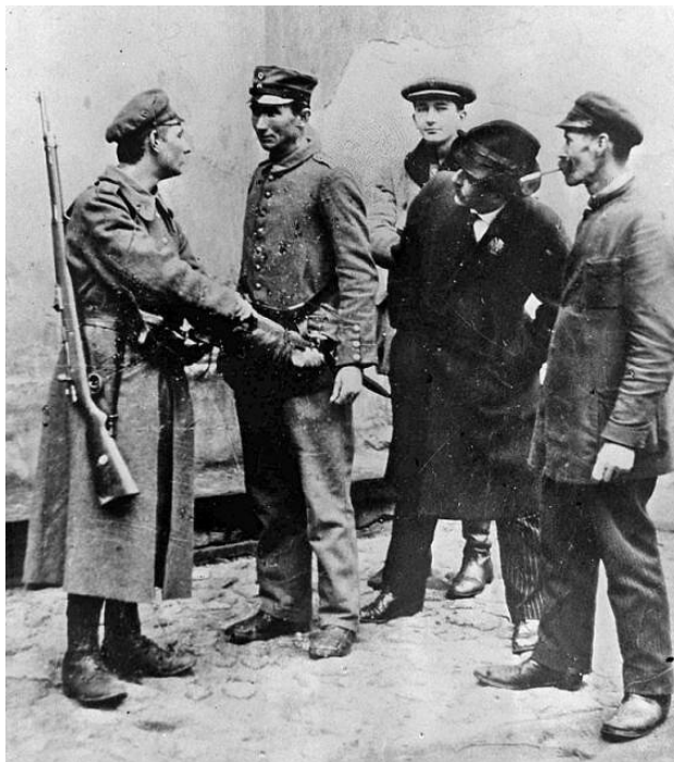
Rozbrajanie Niemców w Warszawie, 11 listopada 1918 r.