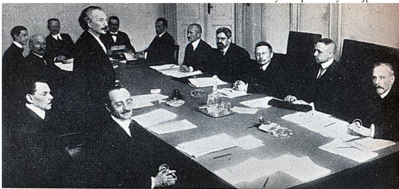
Rząd Ignacego Jana Paderewskiego.

Narodowego Polski w Paryżu Ignacego Jana Paderewskiego 26 grudnia doprowadziło do porozumienia z Józefem Piłsudskim. Ten ostatni zdawał sobie sprawę z potrzeby kompromisu, zarówno ze względu na dobro państwa, jak i konieczność uznania rządu na arenie międzynarodowej. Wiedział bowiem, że na zbliżającej się konferencji wersalskiej Polskę musiał reprezentować jeden ośrodek władzy. Ostatecznie 16 stycznia 1919 r. doszło do utworzenia rządu Ignacego Paderewskiego . Jego członków można zobaczyć na poniższym zdjęciu.