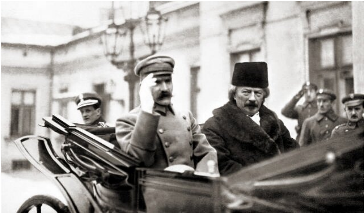
Józef Piłsudski i Ignacy Jan Paderewski, styczeń 1919 r.