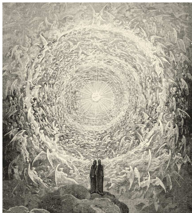
Gustave Doré, ilustracja do Boskiej Komedii .

Platon przeciwstawił wiedzy pozornej wiedzę pewną, a rzeczom zmysłowym inny rodzaj bytu – niematerialne, niezmiennie, doskonałe i realnie istniejące idee. Naczelną, znajdującą się na szczycie hierarchii ideą było dobro. Widoczna na rycinie Gustave'a Dorego wizja Empireum z Boskiej komedii Dantego inspirowana była Platońską koncepcji hierarchii idei ze znajdującą się na szczycie ideą Dobra.