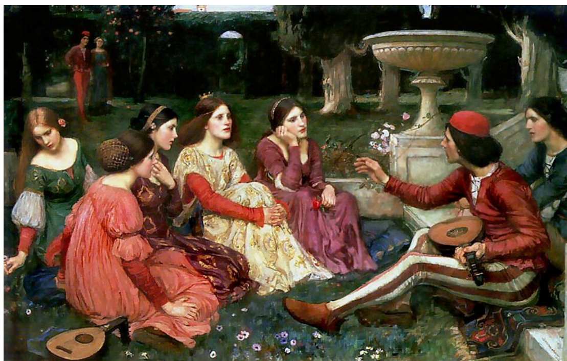
Opowieść z Dekameronu , John William Waterhouse [czytaj: dżon ɥiliam łoterhals]

Przykładem jest utwór Trzy pierścienie z następującym podtytułem: Melchizedech, Żydowin, opowieścią o trzech pierścieniach salwuje się z niebezpieczeństwa, jakie mu Saladyn gotował . Tę krótką nowelę umieścił pisarz na początku cyklu, jest trzecią opowieścią pierwszego dnia. Tematycznie nawiązuje do poprzedzającej ją drugiej historii, opisującej przygodę Żyda Abrahama.