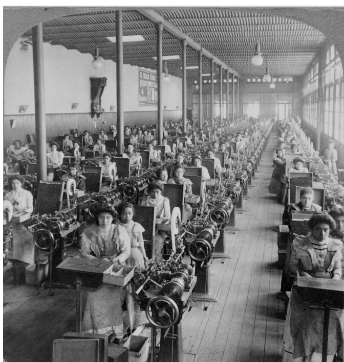
Praca w fabryce papierosów w Nowym Meksyku, ok. 1900 r.