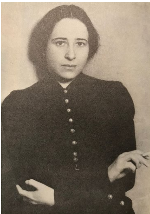
Hannah Arendt (1906–1975), niemiecka teoretyczka polityki, filozofka i publicystka

Według Karola Marksa rewolucję w ekonomicznym momencie krytycznym wywołuje klasa polityczna uciskana przez inną klasę w celu uzyskania większego zakresu wolności, ale przede wszystkim sprawiedliwości ekonomicznej i społecznej.