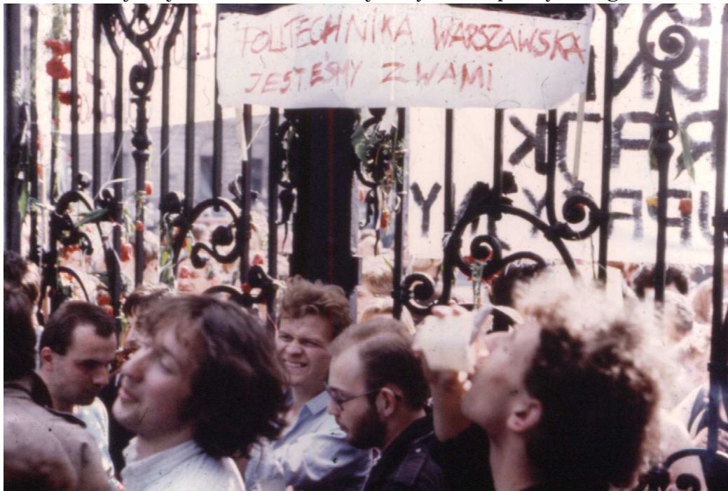
Protesty studenckie z maja 1988 roku

Transformacja nie jest terminem nowym, ale szeroko rozpowszechnionym po przeobrażeniach ustrojowo-politycznych i społeczno-ekonomicznych państw Europy Środkowej i Wschodniej oraz republik byłego Związku Sowieckiego. Transformacja w tym ujęciu służy do określania procesu przemian wiodących od socjalistycznego systemu społecznego do państwa liberalno-demokratycznego i gospodarki rynkowej. W sferze gospodarki jest to proces przechodzenia od gospodarki nakazowo-rozdzielczej do gospodarki rynkowej. Te jakościowe przeobrażenia wymagają zmian w wielu dziedzinach życia społeczno-gospodarczego. Pojęcie to obejmuje więc wiele zjawisk życia społeczno-politycznego i ekonomicznego, a także kulturalnego i duchowego. Należy także zaznaczyć, że czasem używa się dla określenia przeobrażeń o charakterze globalnym terminu transformacja systemowa , a dla określenia przeobrażeń związanych z państwem – pojęcia transformacja ustrojowa . Natomiast biorąc pod uwagę procesy, jakie zachodziły w Polsce, transformację systemową można w naszym kraju odnieść do zmian na wszystkich płaszczyznach, a ustrojową – do zmian wewnątrz systemu politycznego.