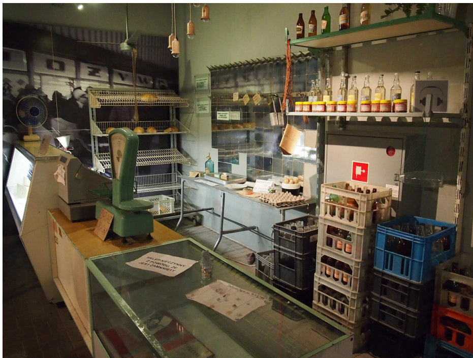
Rekonstrukcja sklepu spożywczego z przełomu lat 70. i 80.

Wprowadzenie gospodarki rynkowej służy wprawdzie celowi, jakim jest osiągnięcie dużych zdolności wytwórczych i dobrobytu, ale wiąże się z nią duże koszty społeczne. W fazie przejściowej ma ona nawet efekty odwrotne, a jej niepowodzenia prowadzą do kumulowania negatywnych efektów w sferze dochodów i zatrudnienia. Istotnym zabiegiem modernizacyjnym jest stworzenie takiego programu przejściowego, który można przeforsować na płaszczyźnie politycznej. Również zdobycie akceptacji społecznej przy zawężonym konsensusie wymaga konieczności stosowania stopniowych rozwiązań reformatorskich.