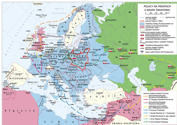
Polacy na frontach II wojny światowej

wyzwolono po czterech dniach walk 1 listopada 1944 roku. W bazie Wilhelmshaven , dywizja zakończyła swój szlak bojowy. I Samodzielna Brygada Spadochronowa gen. Sosabowskiego walczyła pod Arnhem w czasie operacji Market-Garden . Natomiast II Korpus walczył głównie we Włoszech, wyzwalając Ankonę, Bolonię, a zwłaszcza wślwiąjąc się walkami o Monte Cassino .