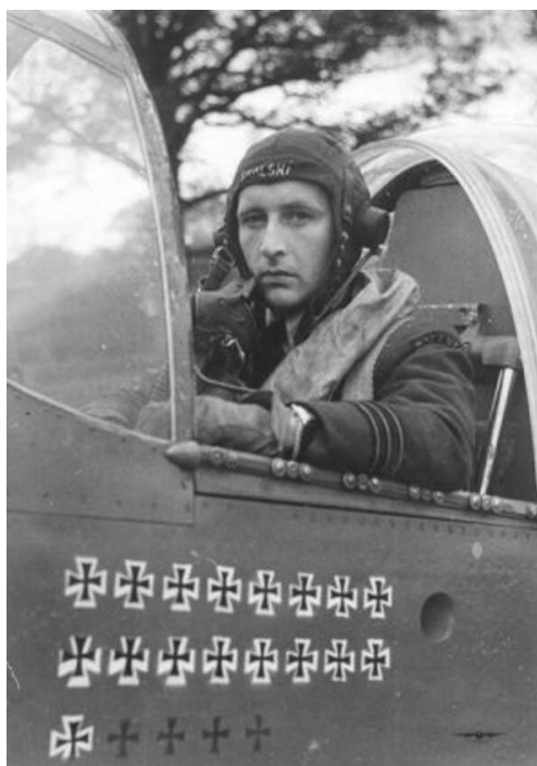
Stanisław Skalski, zdjęcie z czasów II wojny światowej

Polscy piloci uczestniczyli też w alianckich nalotach na Niemcy, natomiast w Afryce walczył 'Polski Zespół Myśliwski' tzw. 'Cyrk Skalskiego' dowodzony przez Stanisława Skalskiego .