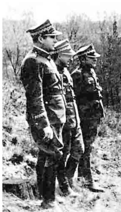
Karol Świerczewski, Marian Spychalski, Michał Rola-Żymierski