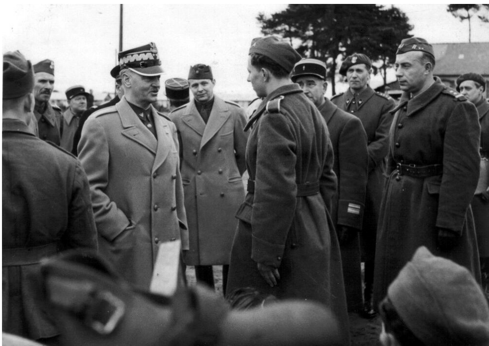
Władysław Sikorski wizytuje polskich żołnierzy, Francja 1940 r.

oficerowie uciekli do Mandżurii. Sikorski w to nie uwierzył, nie chciał jednak doprowadzić do zaognienia sytuacji: zależało mu, żeby warunki armii Andersa się poprawiły. Rozmowy niewiele zmieniły, dlatego gdy Brytyjczycy zaproponowali, żeby polskie siły wzmocniły ich oddziały przy ochronie roponośnych pokładów w Iraku i Iranie, gen. Anders postanowił wykorzystać sytuację i rozpoczął ewakuację wojsk polskich z ZSRS na teren Bliskiego Wschodu w 1942 roku. Na mocy ustaleń między Władysławem Sikorskim a Stalinem zamierzano ewakuować około 25 tys. żołnierzy, później zwiększono tę liczbę do 30 tys. żołnierzy i 12 tys. cywilów. Ostatecznie teren ZSRS opuściło ponad 115 tys. osób. Żołnierzom towarzyszyły kobiety i dzieci. Armię Andersa po przybyciu na Bliski Wschód połączono z Brygadą Strzelców Karpackich i sformowano II Korpus.