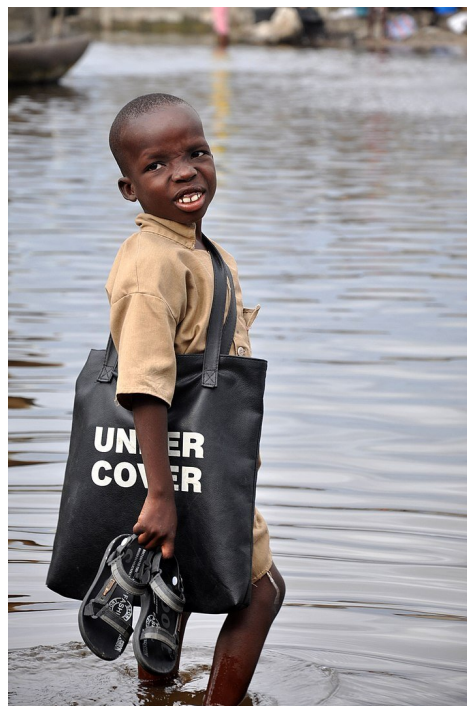
Chłopiec na zdjęciu jest desygnatem nazwy uczeń , ponieważ uczęszcza do szkoły, w której się uczy.

Desygnatem nazwy jest każdy przedmiot, do którego nazwa się odnosi, czyli każdy przedmiot, o którym za pomocą tej nazwy można zgodnie z prawdą orzec (czyli w którym nazwa ta może być orzecznikiem prawdziwego zdania atomowego). Np. desygnatem nazwy Piotr jest każdy człowiek, który nosi to imię, bo o każdym z nich można orzec: Ten człowiek to Piotr . Desygnatem nazwy uczeń jest każdy uczeń, bo o każdym uczniu można orzec: Ten człowiek jest uczniem . Relację pomiędzy nazwą a przedmiotem nazywamy oznaczaniem (desygnowaniem). Zbiór wszystkich desygnatów nazwy w jej określonym znaczeniu stanowi jej denotację , czyli zakres. Gdy słowo jest wieloznaczne,