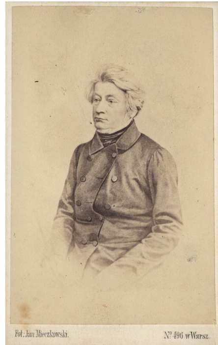
Adam Mickiewicz (1798–1855).

Źródło: Adam Mickiewicz, Dziela , t. 5, Warszawa 1952, s. 276–277.