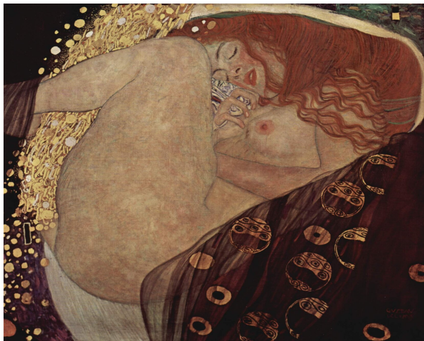
Gustav Klimt, „Danae”, 1907-1908, Muzeum w Wiedniu, Austria, Domena Publiczna