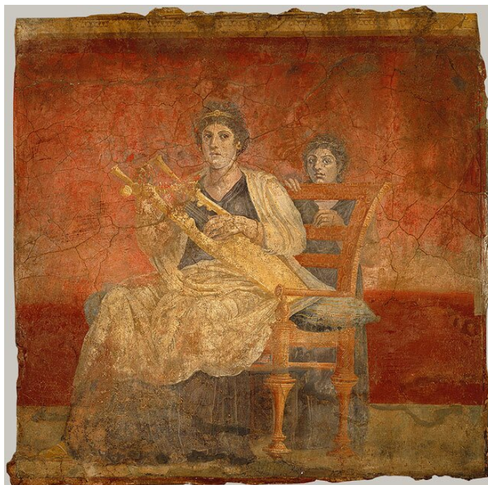
Kobieta z kitarą (fresk), ok. 40–30 r. p.n.e.