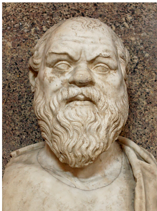
Sokrates (469–399 p.n.e.) urodził się i żył w Atenach.

Sokrates był obywatelem Aten, ale od udziału w życiu publicznym z jego zgromadzeniami i debatami wolał prowadzić raczej rozmowy w nielicznym gronie uczniów i przyjaciół. Jako że nie wykonywał praktycznie żadnego zawodu, można bez przesady powiedzieć, że całe dni spędzał na dysputach