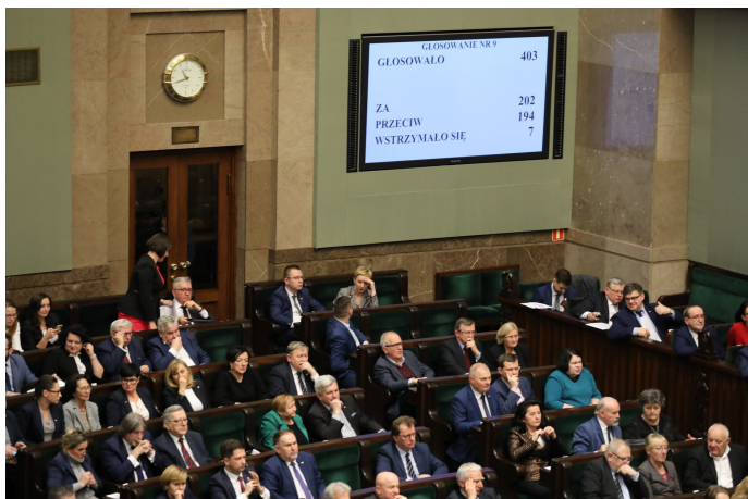
Głosowanie w Sejmie RP