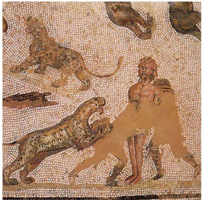
Mozaika z III w. przedstawiająca tzw. damnatio ad bestias , czyli karę śmierci poprzez rzucenie dzikim zwierzętom na pożarcie na arenie. Często właśnie ten rodzaj kary stosowano wobec chrześcijan.

Warto zadać w tym miejscu pytanie: dlaczego Rzymianie prześladowali chrześcijan, a nie – Żydów? Otóż, dla Rzymian religia judaistyczna była co prawda zjawiskiem dziwnym i w wielu aspektach znacznie różniącym się od innych wierzeń śródziemnomorskich, do których byli oni przyzwyczajeni. Niemniej, judaizm, jako religia starożytna („religio antiqua”) był przez Rzymian szanowany właśnie ze względu na długą tradycję, która za nim stała. To, w oczach Rzymian, sankcjonowało wiarę żydowską i gwarantowało jej tolerancję oraz przywileje, o których chrześcijanie nie mogli marzyć.