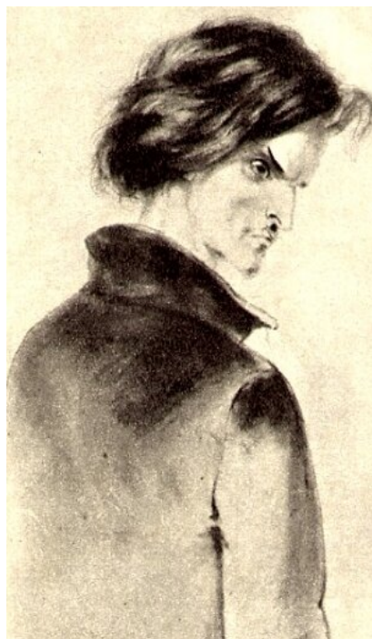
Piotr Boklewski, Raskolnikow , lata 80. XIX w.

Motywy, którymi kierował się Rodion Raskolnikow, zabijając starą lichwiarkę, są rozmaicie interpretowane. Najważniejszym wydaje się przekonanie Raskolnikowa o własnym geniuszu i wyjątkowości, które pozwalają mu, nadczyłownikowi , zabijać „ludzkie wszy” w imię sprawiedliwości społecznej. Inną, bardziej prozaiczną przyczyną są względy materialne: Raskolnikow potrzebuje pieniędzy. Jednak w obliczu popełnionej zbrodni, przytłoczony poczuciem winy, zabiera z mieszkania lichwiarki tylko drobną sumę. Tymczasem rozpacz, która go pochłania, jest bez porównania ciemniejsza niż wszystko, czego dotąd doświadczył.