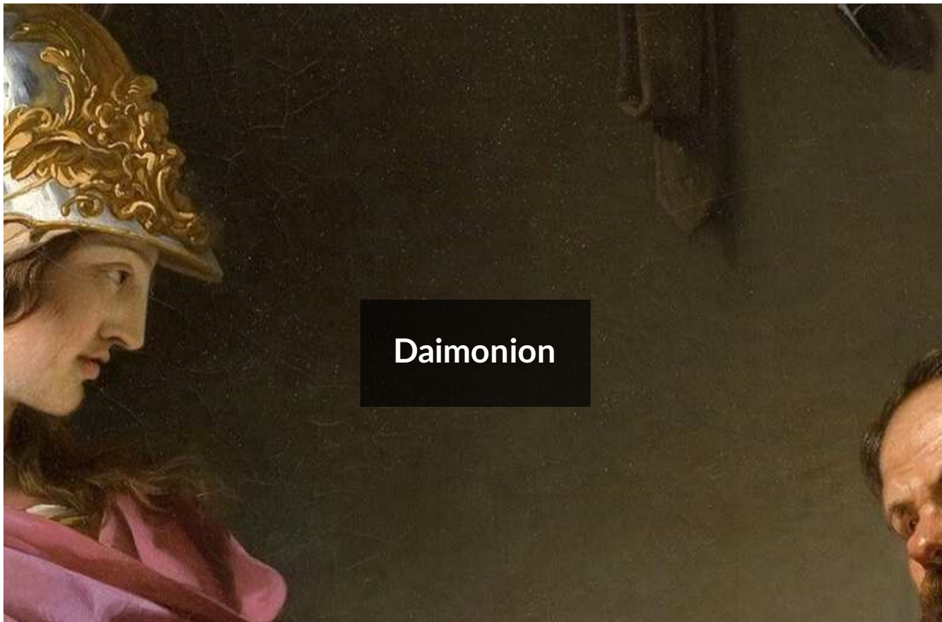
François-André Vincent, Sokrates poucza Alkibiadesa, za nim widoczny jest Daimonion, fragment, 1776.

Źródło: Wikimedia Commons, domena publiczna.