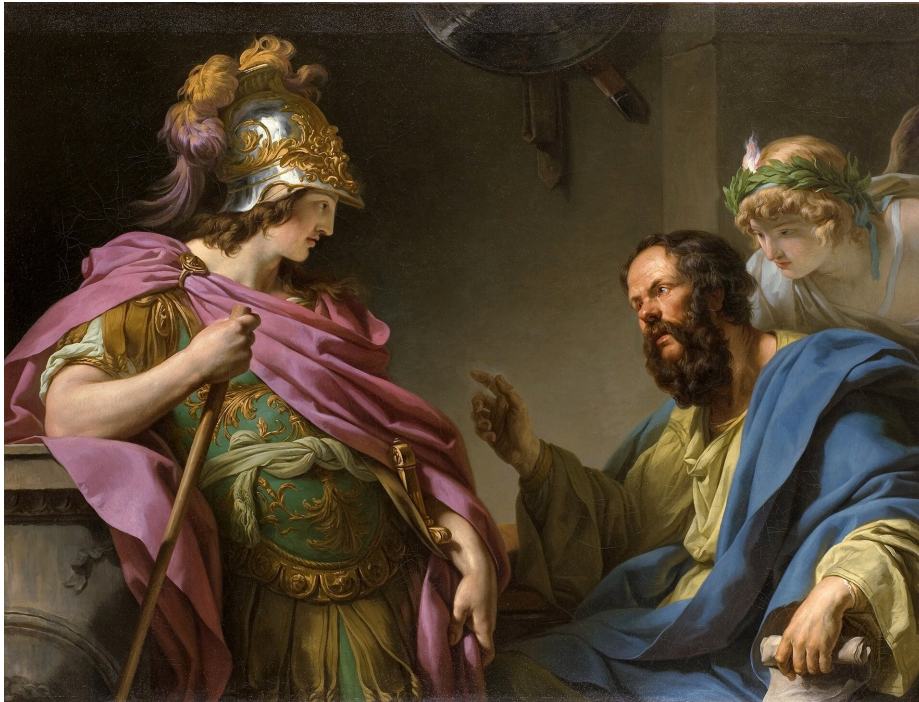
Sokrates z Alkibiadesem i Daimonion. Obraz olejny François-André Vincent, 1776, Muzeum Fabre, Montpellier.

Opis daimoniona znajdujemy przede wszystkim w dziełach Platona i Ksenofonta, przy czym świadectwa ich w pewnych sprawach się różnią. W późniejszym piśmiectwie historycznym i filozoficznym opisy sokratejskiego daimoniona znajdujemy u Cyserona, Diogenesa Laertiosa, Apulejusza czy Plutarcha. Brak natomiast filozofów, którzy podążaliby śladem Sokratesa i przyznawali się do podobnego jak jego doświadczenia.