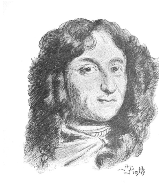
Henryk Piątkowski, Jan Andrzej Morsztyn , ok. 1898