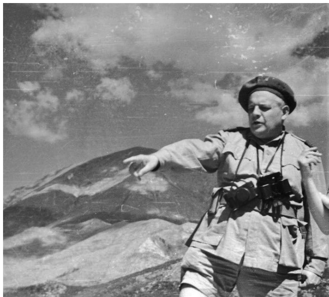
Melchior Wańkowicz na polu bitwy o Monte Cassino, maj 1944

W trakcie II wojny światowej, pracując jako nieoficjalny kronikarz II Korpusu Polskiego, Wańkowicz przemierzył szlak od Iranu i Iraku przez Syrię, Liban, Egipt do Włoch, gdzie wziął udział w bitwie o Monte Cassino. Owocem tej pracy był monumentalny, trzytomowy reportaż Bitwa o Monte Cassino , pisany w Rzymie i Mediolanie w latach 1945–1946. Powojenna twórczość Wańkowicza była bardzo różnorodna i obejmowała zarówno reportaże z podróży (m.in. Tworzywo ), wspomnienia i felietony, jak i eseje, np. dwutomowa Karafka La Fontaine'a , będąca zbiorem uwag na temat pisarskiego warsztatu autora.