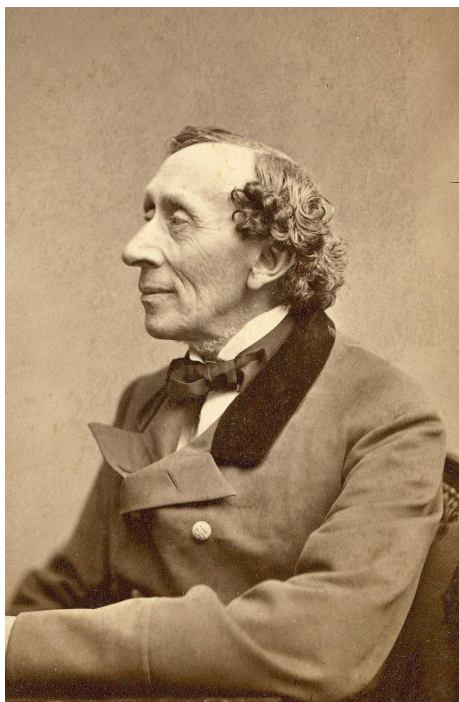
Hans Christian Andersen