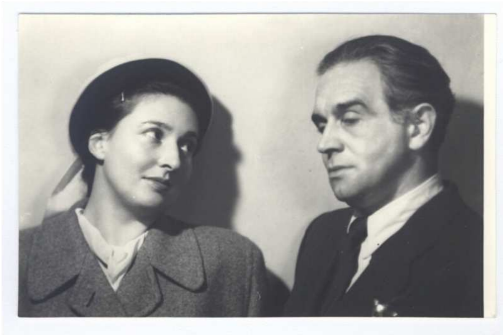
Portret Natalii i Konstantego Ildefonsa Gałczyńskich