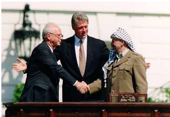
Premier Izraela Icchak Rabin, prezydent USA Bill Clinton i przewodniczący OWP Jasir Arafat.

W latach 80. i 90. XX wieku Palestyńczycy kontynuowali walkę o utworzenie własnego państwa lub przynajmniej rozszerzenie autonomii na terytorium Izraela. Najważniejszym ugrupowaniem, które z czasem zaczęto uważać za ich oficjalną reprezentację, była Organizacja Wyzwolenia Palestyny. W 1993 r., dzięki mediacji międzynarodowej, zakończyły się rozmowy między rządem Izraela a OWP. Podpisano wówczas w Oslo układ, zgodnie z którym organizacja to uznała istnienie państwa Izrael, a Izrael zgodził się na utworzenie w Strefie Gazy i na Zachodnim Brzegu Jordanu Autonomii Palestyńskiej, czyli wydzielonego obszaru zamieszkanego przez Palestyńczyków. Na czele autonomii jako prezydent stanął w 1994 r. przywódca OWP, Jasir Arafat.