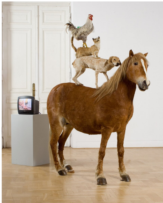
Katarzyna Kozyra, Piramida zwierząt , 1993

Wyjaśnij, w jaki sposób współczesna sztuka może nawiązywać do założeń naturalizmu. W swojej odpowiedzi odwołaj się do Piramidy zwierząt - rzeźby Katarzyny Kozyry, która została wykonana z wypchanych ciał wybranych przez autorkę zwierząt.