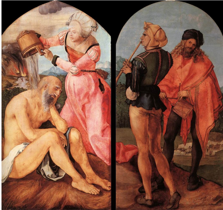
Albrecht Dürer, Hiob z żoną, skrzydło Ołtarza Jabacha , ok. 1504