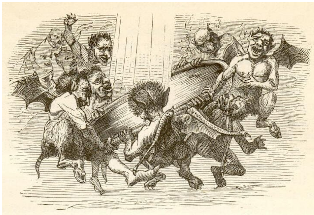
Hans Christian Andersen, Nowe baśnie , il. Vilhelm Pedersen, Kopenhaga 1844 r.