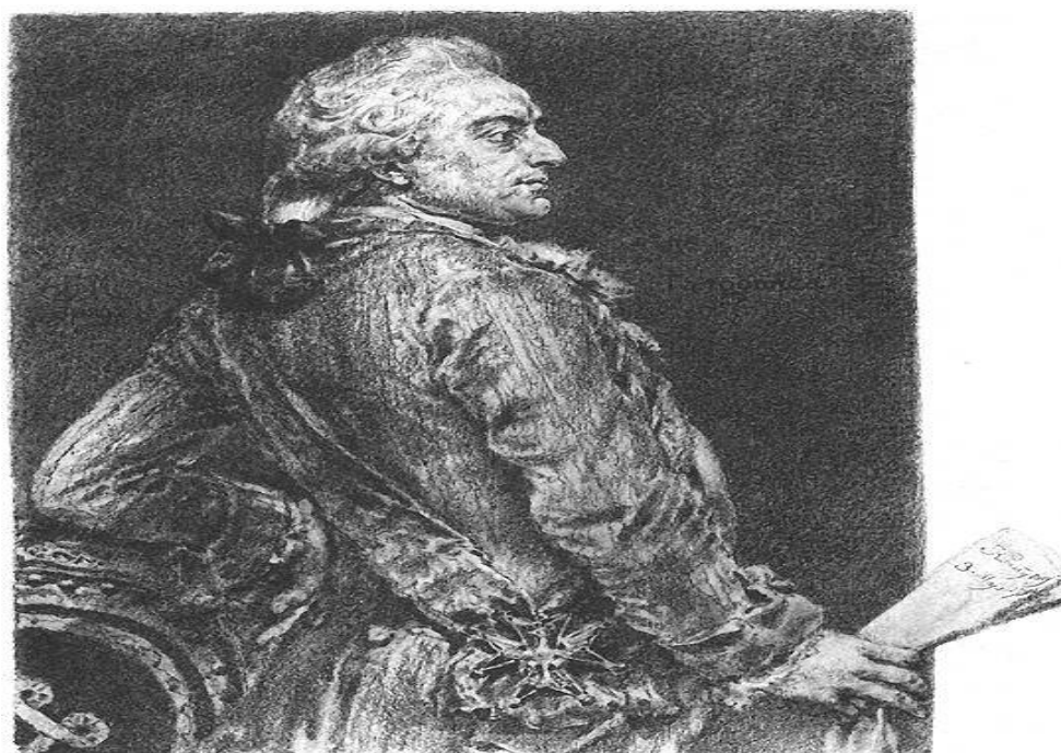
król Polski, Stanisław August Poniatowski

Źródło: Jan Matejko, Stefan Batory , 1890, domena publiczna.