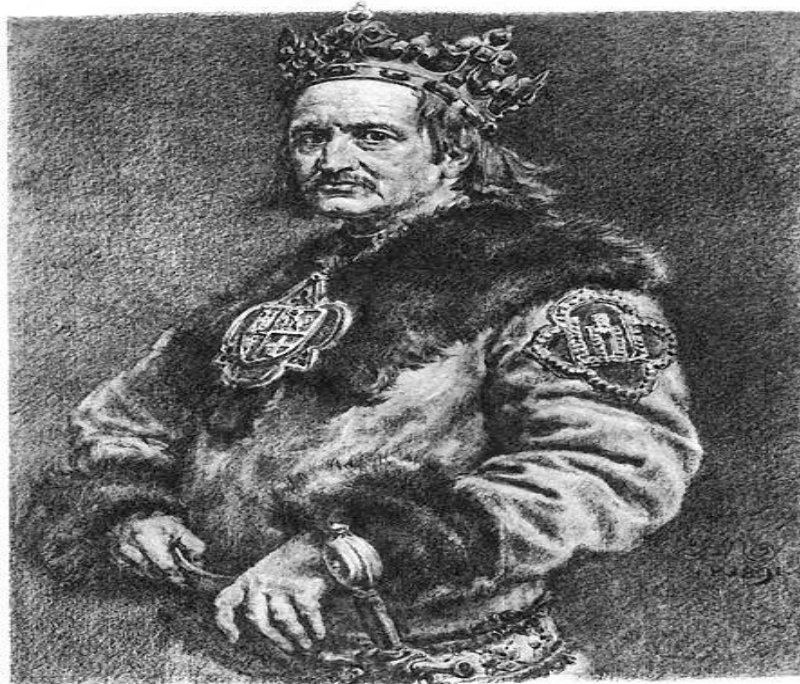
król Polski, Władysław Jagiełło

Źródło: Jan Matejko, Kazimierz III Wielki , 1890, Muzeum Narodowe we Wrocławiu, domena publiczna.