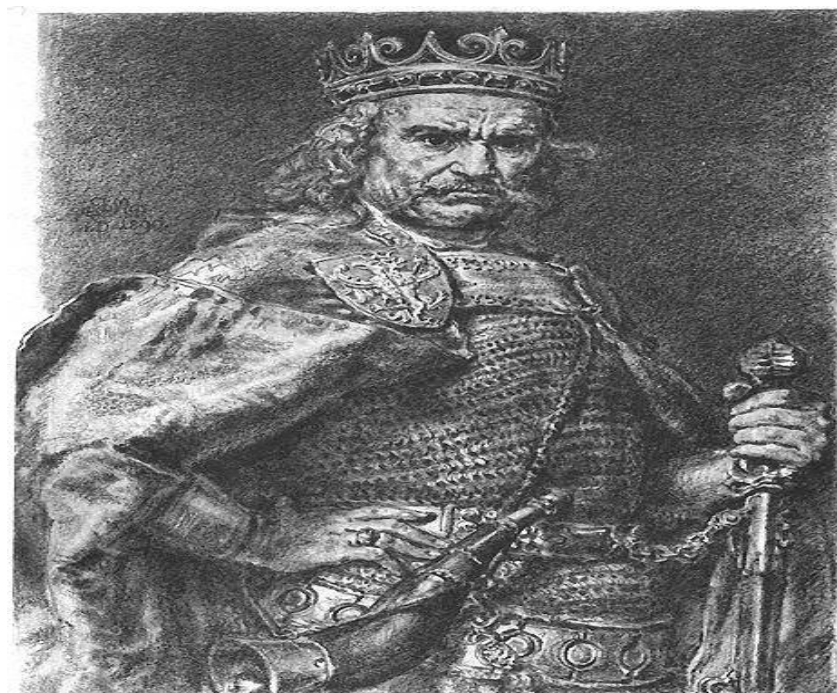
król Polski, Władysław Łokietek

Źródło: Jan Matejko, Bolesław I Chrobry , 1890, domena publiczna.