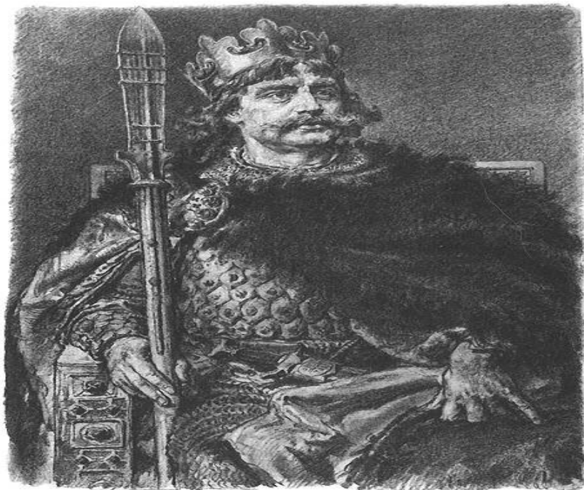
I król Polski, Bolesław Chrobry

Utwórz peryfrazy królów, których widzisz na portretach.