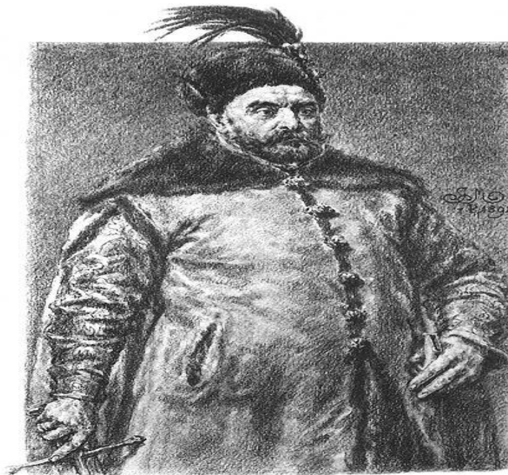
król Polski, Stefan Batory

Źródło: Jan Matejko, Stefan Batory , 1890, domena publiczna.