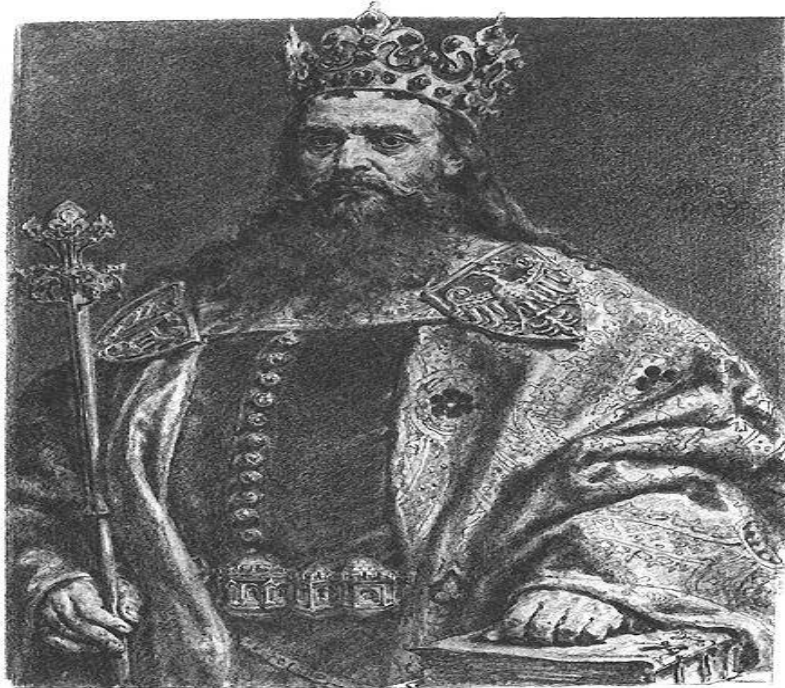
król Polski, Kazimierz Wielki

Źródło: Jan Matejko, Kazimierz III Wielki , 1890, Muzeum Narodowe we Wrocławiu, domena publiczna.