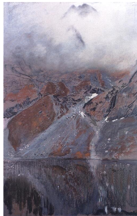
Leon Wyczółkowski, Mnich nad Morskim Okiem , 1904

W wierszu Tetmajera szczególną wartość poetycką mają synestezje spajające warstwę brzmieniową tekstu z wrażeniami dotyczącymi innych zmysłów (plastycznymi, dotykowymi itd.). W sformułowaniu: