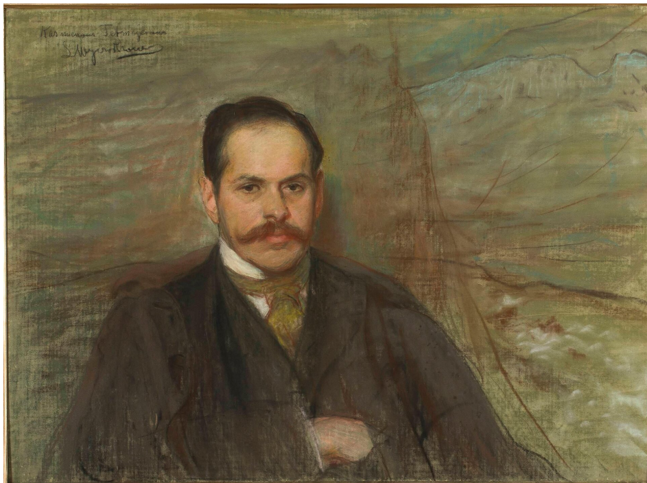
Leon Wyczółkowski, Portret Kazimierza Przerwy-Tetmajera , przed 1901

Wiersz Melodia mgieł nocnych Kazimierza Przerwy-Tetmajera jest przykładem wykorzystania w poezji stylu impresjonistycznego , który zainspirował przemiany w polskiej liryce przełomu wieków. Twórcy, próbując oddać niepowtarzalne wrażenia doznawane przez ludzkie zmysły, kreowali nastrojowe, poetyckie pejzaże. Aby wywołać u czytelnika oczekiwane doznania, korzystali z szeregu środków artystycznych. Szczególnie charakterystyczna dla tego okresu w literaturze była synestezja . Melodia mgieł nocnych już w tytule odwołuje się do różnych zmysłów, łącząc bodźce dźwiękowe z widokiem mgieł.