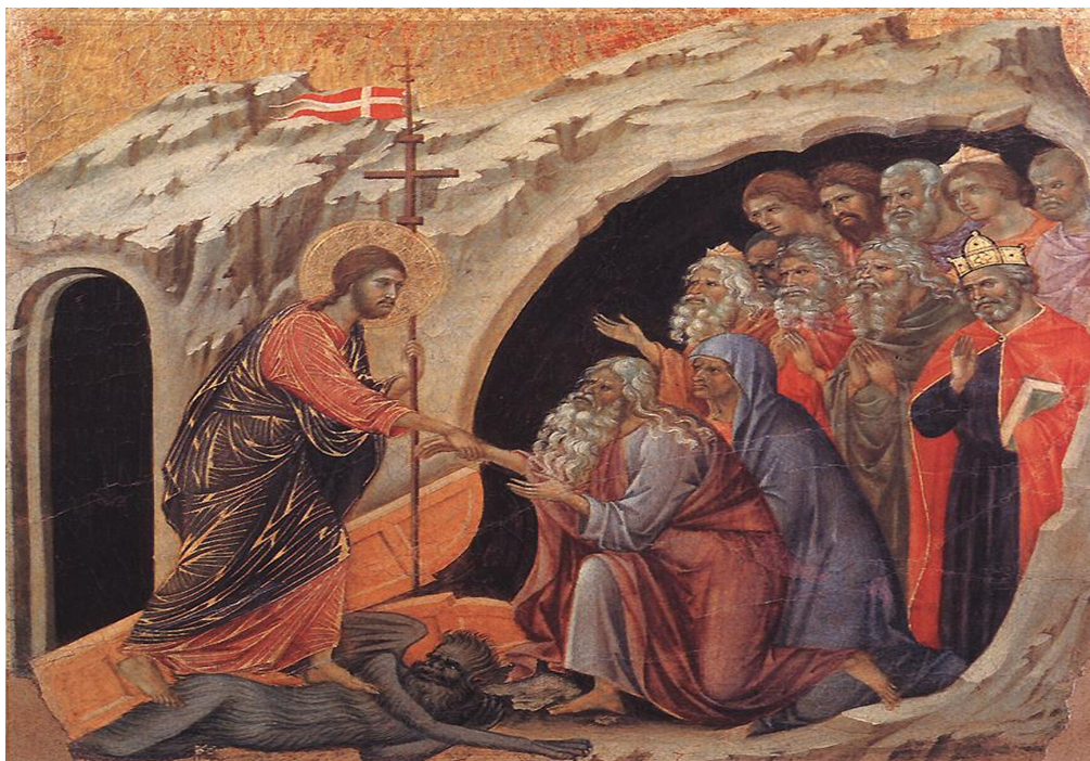
Duccio di Buoninsegna, Zstąpienie Chrystusa do piekieł (Der Abstieg Christi in den Limbus) , 1308–1311