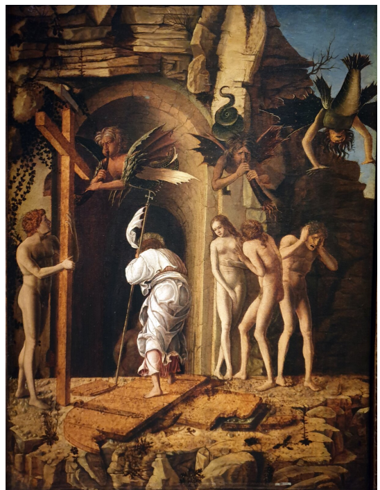
Giovanni Bellini, Zstąpienie Chrystusa do piekieł , 1475-1480