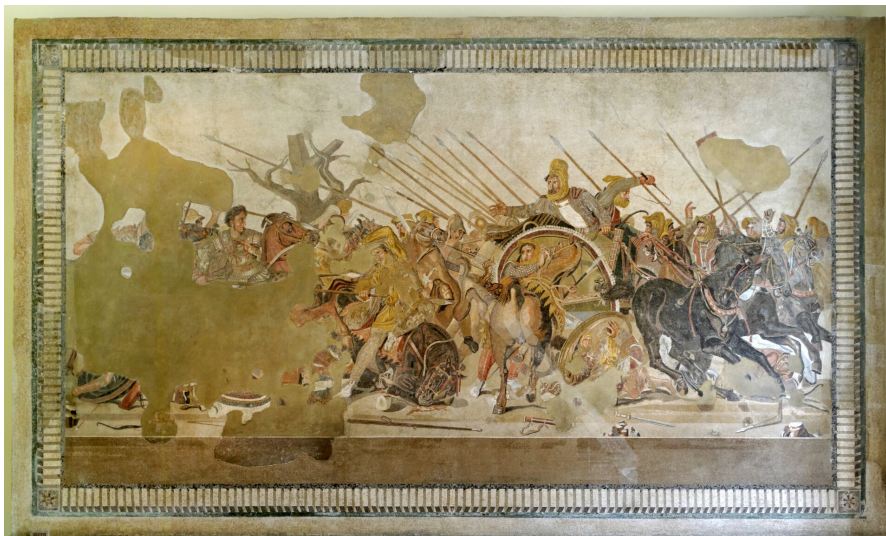
„Bitwa Aleksandra Wielkiego”, przed 79 n.e., z Domu Fauna w Pompejach, Narodowe Muzeum Archeologiczne w Neapolu, Włochy